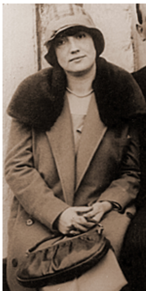
La Nonna di Marino (la nostra Nonna, di Marino paese, non la Nonna di Marino Ignazio)

In alto i calici, Marino, noi ti voteremo! Ci siamo iscritti al Pidì apposta! Abbiamo sacrificato 20 euro non per altro! Sopportiamo d’aver in tasca la firma di Walter Veltroni solo per questo! E poi, vero o finto credente che tu sia o non sia, come potremmo non votarti proprio noi, che abbiamo avuto una Nonna di Marino?